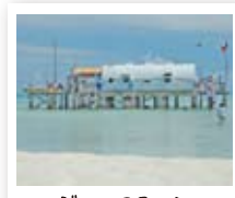
レンジャーステーション