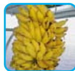
フルーツ食べ放題